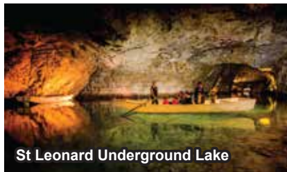
St Leonard Underground Lake